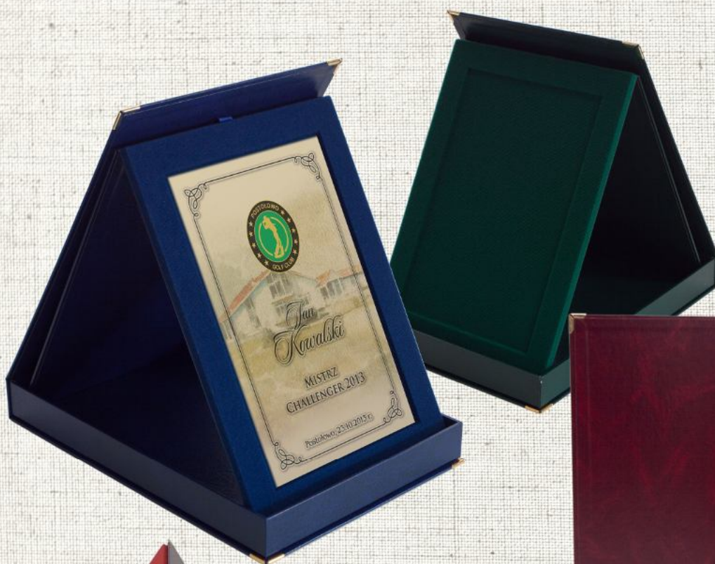
[3] TABLICZKA W RAMCE WELUROWEJ ZE STOPKĄ I FUTERAŁEM

KOLORY: BORDO, ZIELEŃ, GRANAT. WARIANTY: PION/POZIOM MOŻLIWY HOT-STAMPING/EMBLEMAT PRINT+PRESS™ NA OKŁADCE.