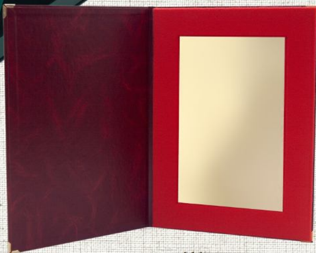
[1] TABLICZKA W OKŁADCE