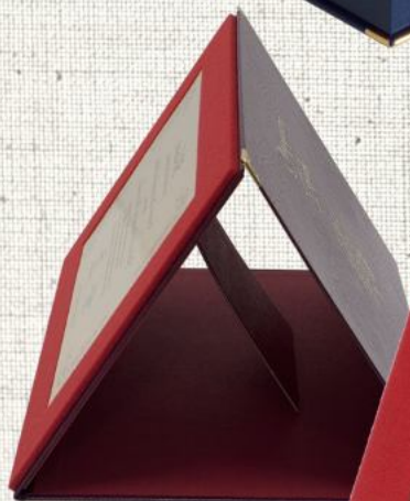
[2] TABLICZKA W OKŁADCE ZE STOPKĄ EKSPOZYCYJNĄ